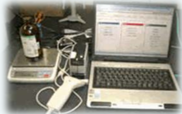
薬品管理システムCRIS