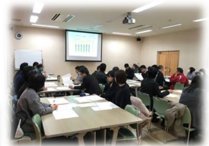
平成29年度内部監査

佐賀大学エコアクションの取組は、本学のホームページ ( http://www.saga-u.ac.jp/ea21saga-u/index.html )で ご覧いただけます。