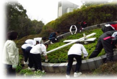
附属学校生徒による佐賀城公園清掃活動