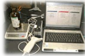
薬品管理システムCRIS

佐賀大学エコアクションの取組は、本学のホームページ ( http://www.saga-u.ac.jp/ea21saga-u/index.html )で ご覧いただけます。