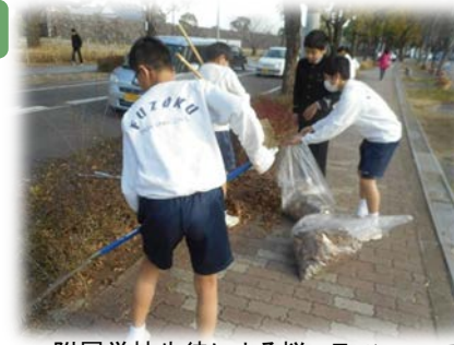
附属学校生徒による桜マラソンコース 周辺清掃活動