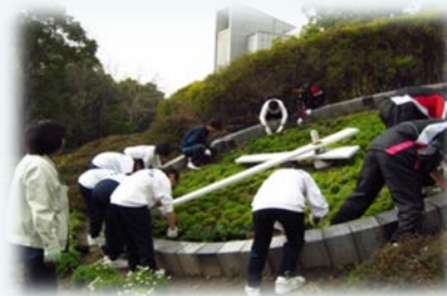
附属学校生徒による佐賀城公園清掃活動