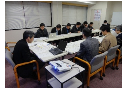
平成28年度内部監査