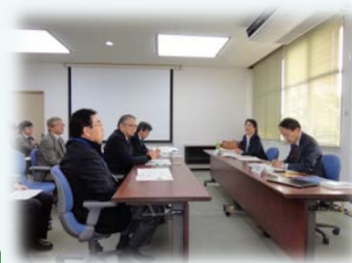
平成25年度EA21更新審査