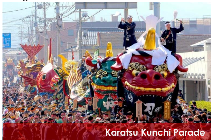
Karatsu Kunchi Parade

On the same period of time, another famous festival "Karatsu Kunchi" was held from 2 nd to 4 th November in Karatsu, Saga. There were 14 floats in the shape of Samurai Helmet, adorable sea brems, dragons and mythical creatures has paraded through Karatsu city followed by the exciting sound of Taiko drums. The locals carried the floats which are about 2 to 5 tons and shout "Enya Enya" and "Yoisa Yoisa" with enthusiasm. The sound of it really made you want to shout alongside with them.