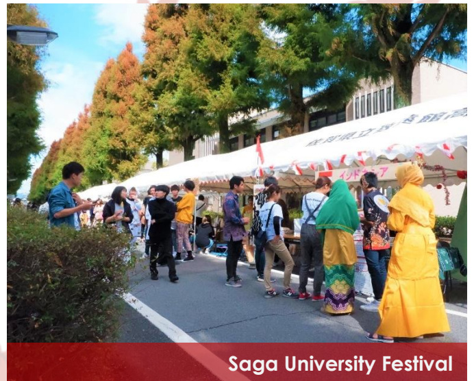
Saga University Festival

Not so far from Saga Saiko and Thai Festival Venue, at Saga University the "22nd Saga University Festival" were held. The theme of this year's festival was "Hop" inspired from the "Hop, Step and Jump" from the Heisei era to the new beginning of Reiwa era. The main road of Saga University was filled with passionate greeting from the students who runs various food and drink store in the "Bazaar". All the stores were run by the student in various Circle for the fund to support their beloved activities. At the same time, several stores were run by saga city locals in the "Gaba Event".