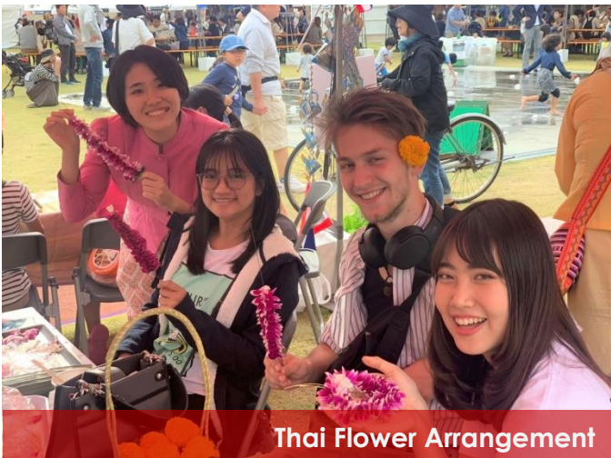
Thai Flower Arrangement

Exhausted from the Saga Saiko Fest, many people came to relax and fill their stomach with Thai food at the Thai Festival held in front of the prefectural library. Visitors could enjoy famous