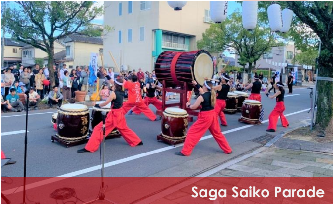
Saga Saiko Parade

"Rediscover Saga culture and charm through arts and music" is the experience "Saga Saiko