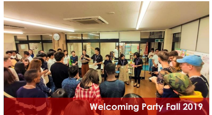
Welcoming Party Fall 2019

Approximately 140 persons joined the welcome party, including international students and Japanese students, creating a great social opportunity in a casual atmosphere. Not only students, but all sort of people such as professors, university staff and representatives of the government and civil society were enjoying the party.