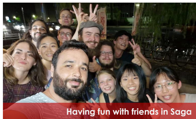
Having fun with friends in Saga

The close-knit circle of international students at Saga University was what made my exchange experience amazing. Whether it was simple day to day talks with a cup of coffee, weekend trips to around Kyushu or study sessions for exams, it was always the best time spent with lovely people. I am truly grateful for the exchange experience in Saga.