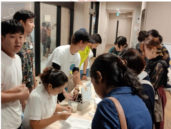
SUIISA's members in duty

important to remember that it is open to every student who wants to join. In fact, one of our main goal is to get the new international students to make new friends with their Japanese and international fellows. SUIISA started as a group of friends with a common goal; to give the new international students a warm welcome to Saga. Also, SUIISA helps to provide them moral support and help them make new friends to begin their new chapter in Saga University in the best possible way. By hosting the welcome party back in fall 2017 as a first event, SUIISA became closer to its goals. 2 years have passed since then and now the welcome party became a part of its annual tradition. SUIISA also widened its activities by organizing events such as the sports event and picnic. With the support of Saga University International Department, a group of SUIISA members started "Hi from Saga" to keep in touch with their fellow international students who have graduated and are now in different parts of the world, hoping that those humble words can reach out to them filling their hearts with the warm memories from their time in Saga.