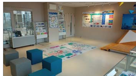
インフォメーション・コーナー