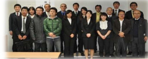
大学院副コース7名、特別の課程8名が修了研究論文を発表