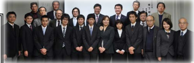
大学院副コース7名、特別の課程5名が修了研究論文を発表