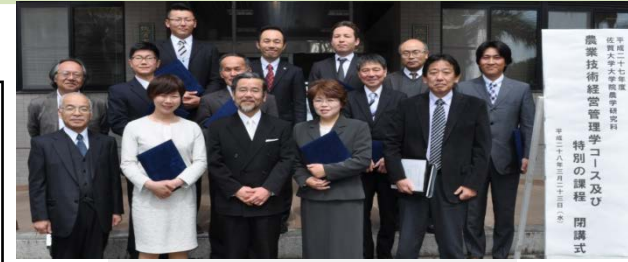
特別の課程9名が修了(H28年3月)