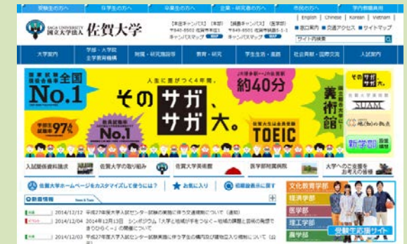
公式ホームページ(上)と特設ページ(下)