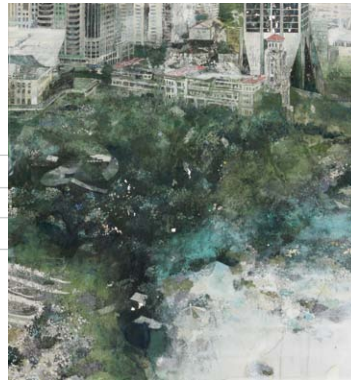
石川誠和 一都市色彩図 一個人