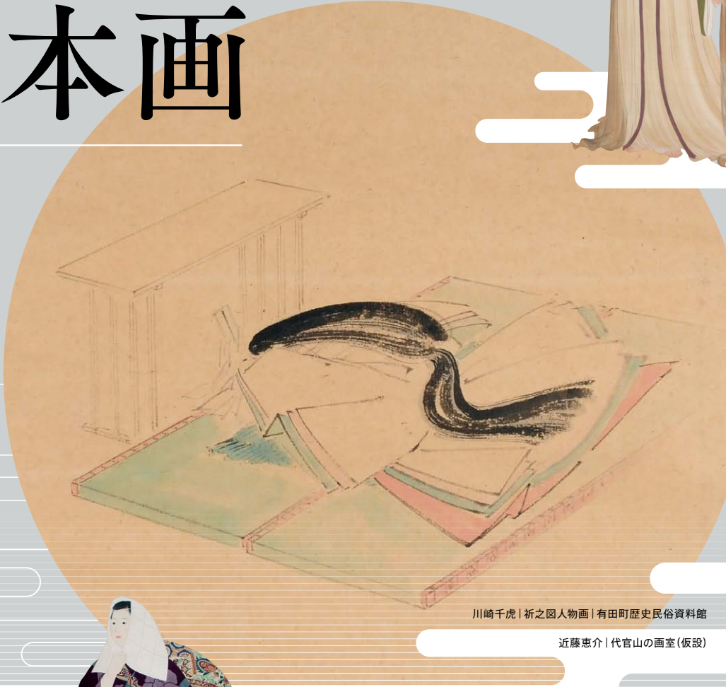
川崎千虎 | 祈之図人物画 | 有田町歴史民俗資料館