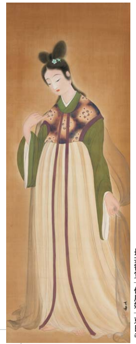
長井智覚 一佐賀 一 恵日寺