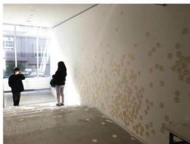
「増殖する、」 シール紙 2020年