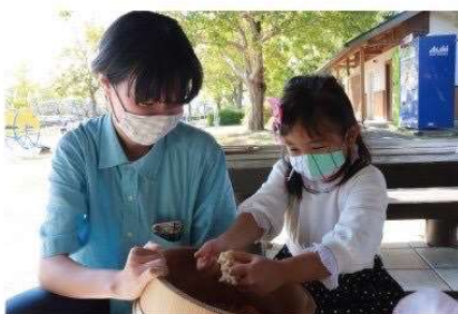
「常在菌味噌コミュニティ」 野外アートプロジェクト・映像（1分51秒） 2020年