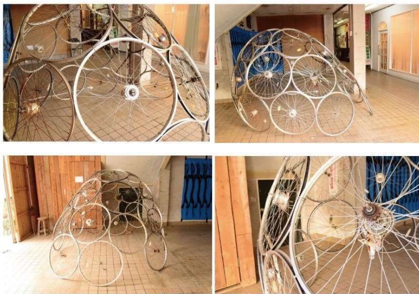
「wheel」 ホイール・針金 2018年