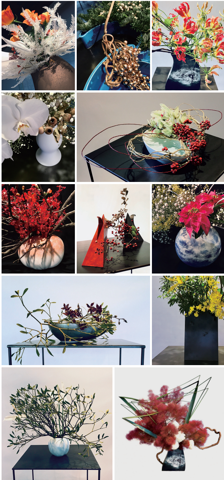
2021年度研究成果 / 草月会館ほかにて発表したいけばな作品