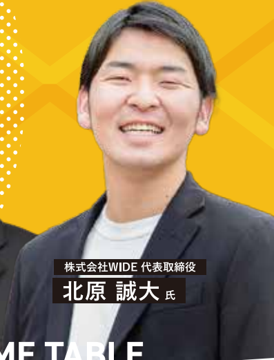
株式会社WIDE 代表取締役