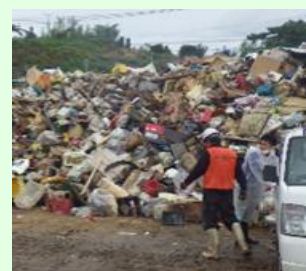
佐賀豪雨災害時の仮置場