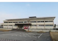
5 スポーツセンター