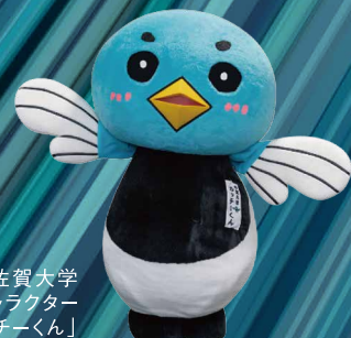
佐賀大学 公式マスコットキャラクター 「カッチーくん」